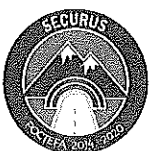
Signé M. José Luis SORO DOMINGO

SEGURIDAD DE LOS USUARIOS DE LOS PASOS TRANSFRONTERIZOS DE BIELSA-ARAGNOUET Y PORTALET SÉCURITÉ DES UTILISATEURS DES ROUTES TRANSFRONTALIERS DE BIELSA ARAGNOUET ET POURTALET